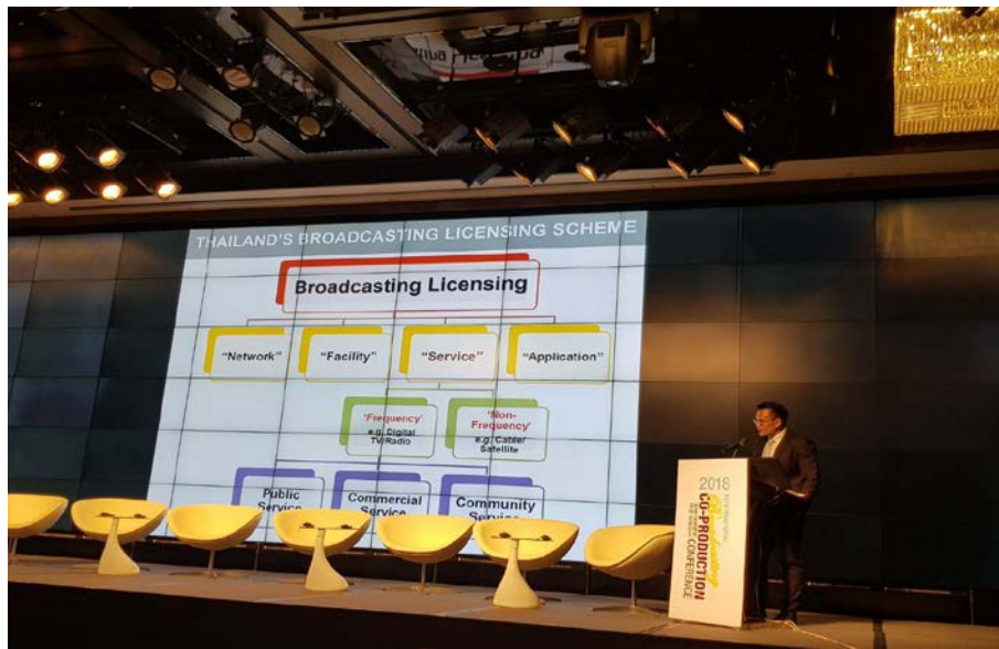
รูปที่ ๕ นายพสุ ศรีศิริธัญ นำเสนอในหัวข้อ Status of Thailand's Broadcasting Industry