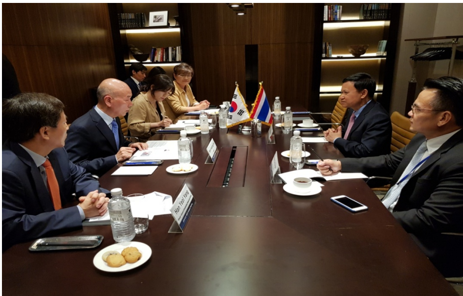
รูปที่ ๓ รองประธาน กสทช. พันเอก ดร. นที ๗ ระหว่างการหารือร่วมกับคณะ KCC